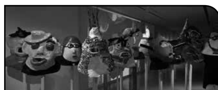
Quelques « Cabuzedos » qui seront présentes au défilé du 27 septembre

Certains sont demandeurs d'activités bénévoles : Laetitia va une ou deux fois par semaine dans une maison de repos, Jean-Pierre donne un coup de main