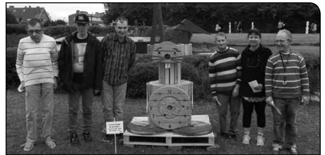
La réalisation du logo de la maison par nos résidents.

dans une ferme... De petits boulots adaptés... mais très enrichissants pour eux.