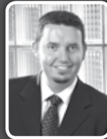
Jean SPITS Gestion bancaire Assurances Entreprise