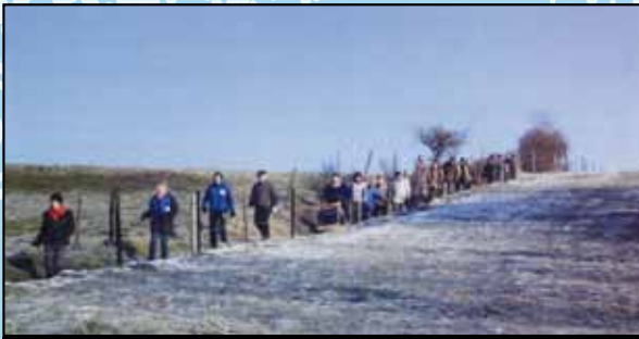
En descendant du point de vue des Houlpais

Le dimanche 28 novembre en matinée, à l'occasion de l'inauguration du panneau des itinéraires de promenades à Saive, placé en face de la salle Louis Arnolis, les membres du groupe REVEIL, en collaboration avec l'administration communale, proposaient une promenade commentée (la promenade N° 14) qui emprunte le circuit du bois des Houlpais.